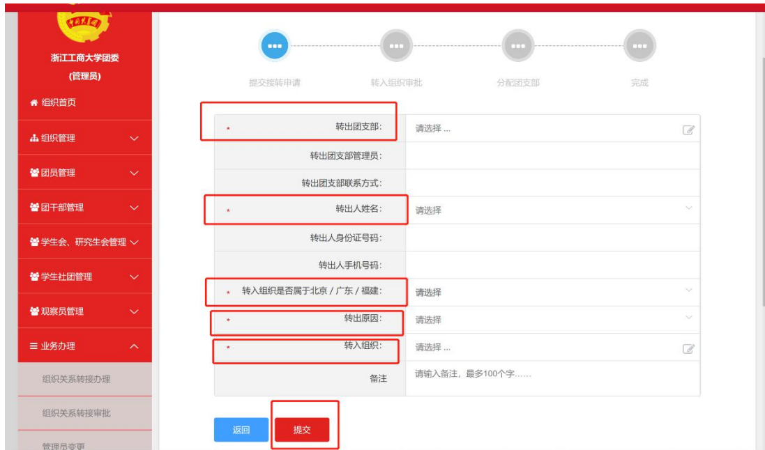
(图：团组织发起转接示意图)